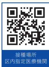
接種場所 区内指定医療機関

※渋谷区から個別にお知らせは発送していません。希望する場合は指定医療機関に直接予約をしてください。乳幼児医療証または子ども医療証(住所確認用)、母子健康手帳をお持ちください。